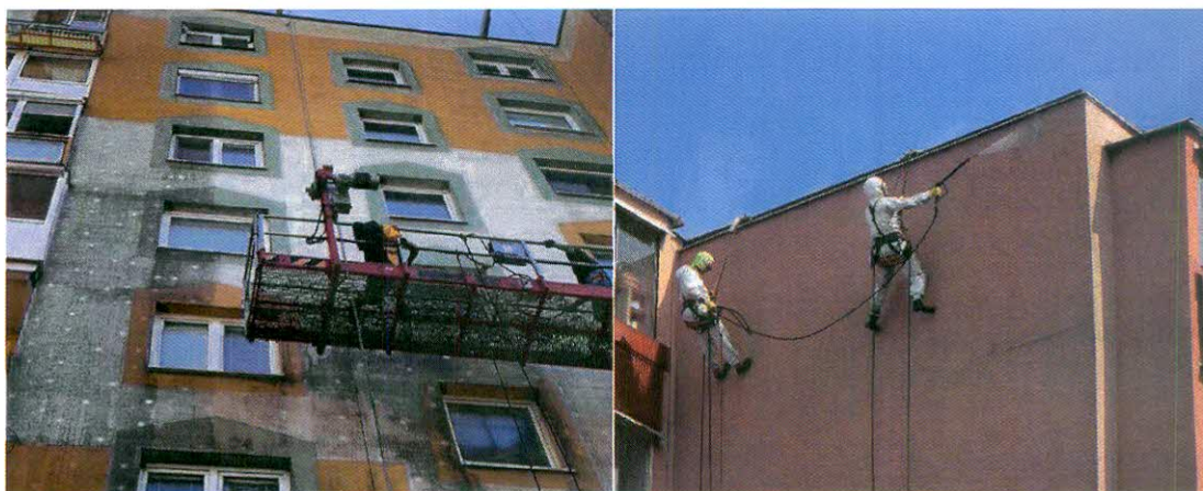
Obr. 3, 4: Umývanie fasády tlakovou vodou.