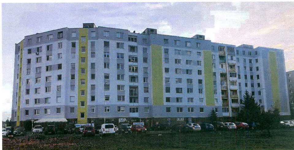
Obr. 11,12: Fasáda v pôvodnom stave a po komplexnej obnove a zmene vizuálu.

Ďakujeme za prejavenu dôveru a tešíme sa na prípadnú spoluprácu.