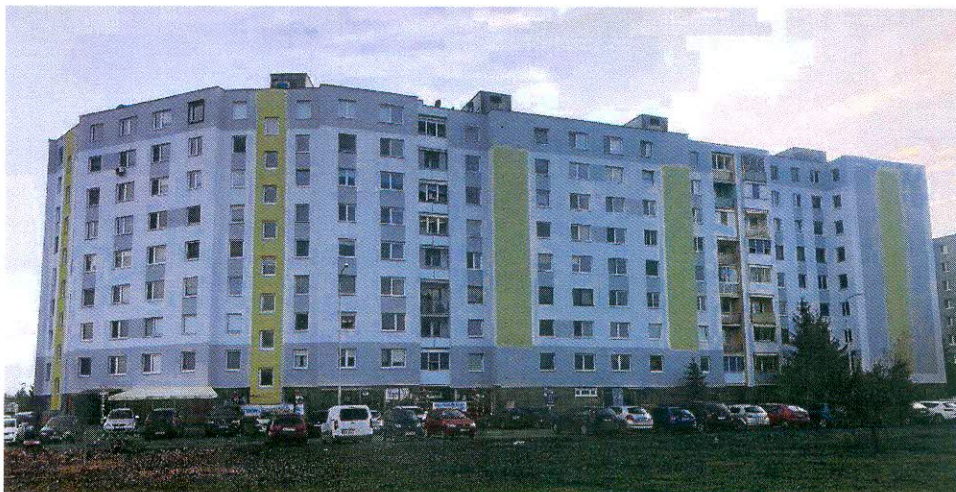
Obr. 11,12: Fasáda v pôvodnom stave a po komplexnej obnove a zmene vizuálu.

Ďakujeme za prejavenu dôveru a tešíme sa na prípadnú spoluprácu.