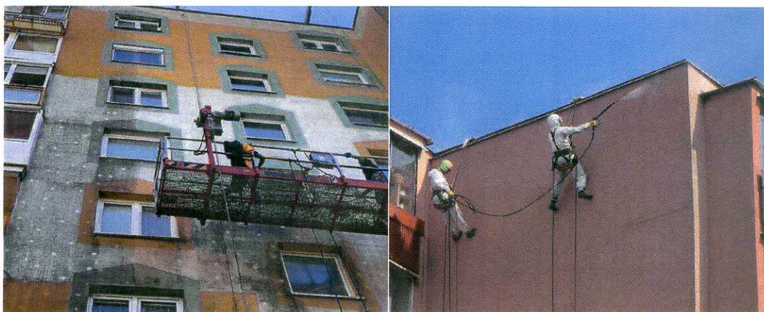
Obr. 3, 4: Umývanie fasády tlakovou vodou.